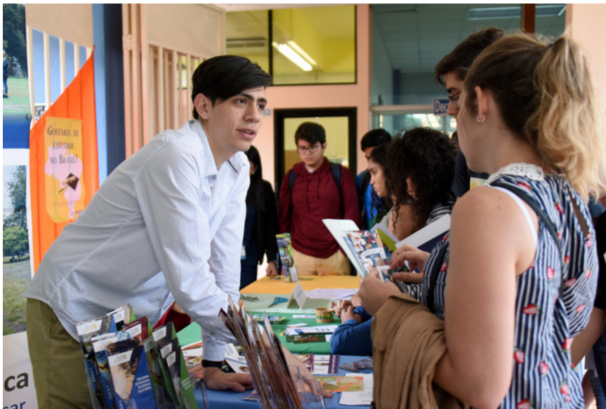
Feria de oportunidades UCR.