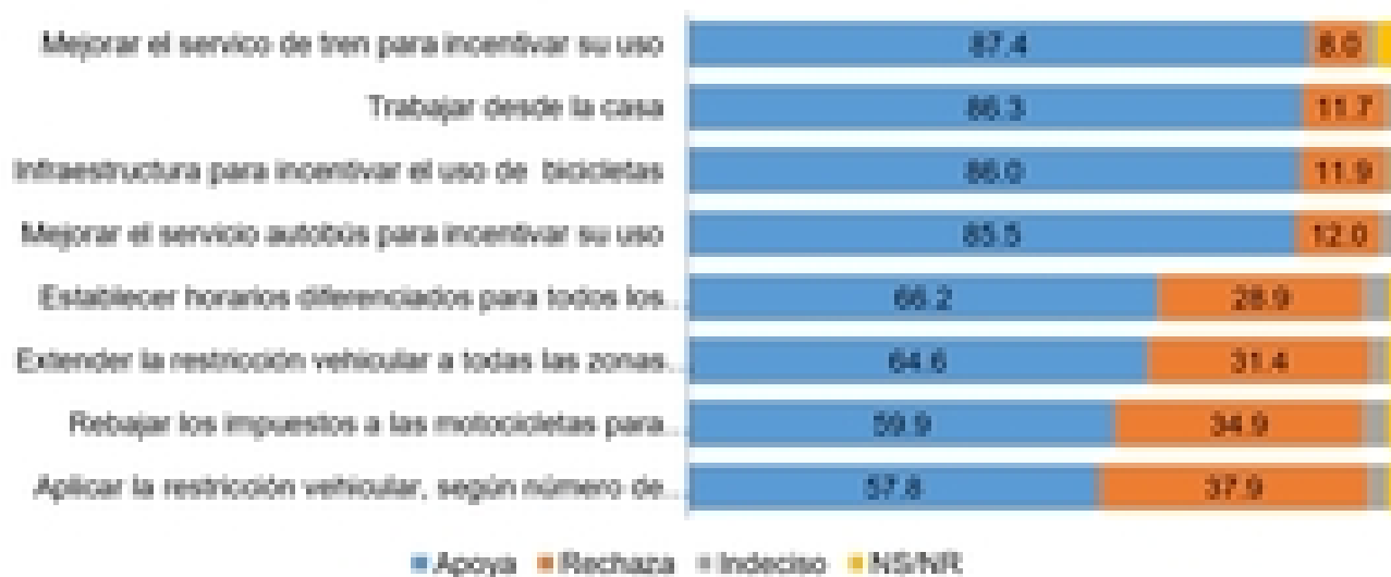
Gráfico 1.4 Opinión acerca de las medidas de descongestión vial (Distribuciones porcentuales)