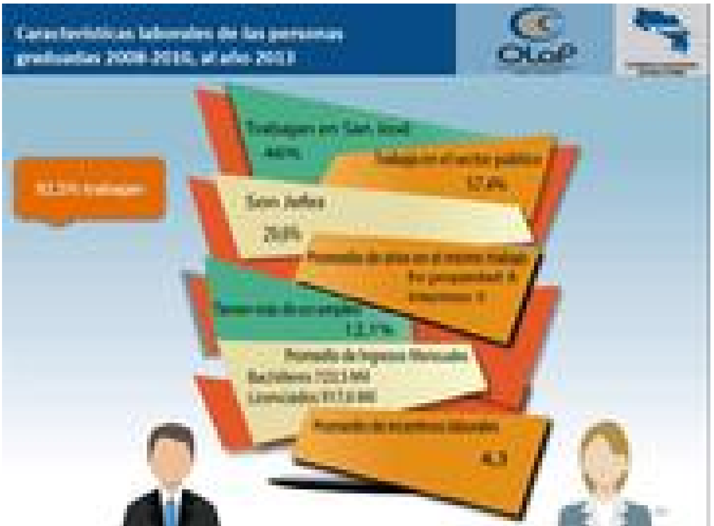
Características de los profesionales que tienen empleo (ilustración cortesía OLAP).

“Se puede notar que hay un margen entre lo que el país obtuvo en porcentajes de desempleo en relación con los porcentajes que obtuvieron cada una de las áreas del conocimiento en esa materia, con esto podemos apreciar que si bien es cierto la crisis nos afecta a todos, la gente que tiene más años de escolaridad tiene un nivel de afectación menor que los que tienen menos años de escolaridad” afirmó Gutiérrez.