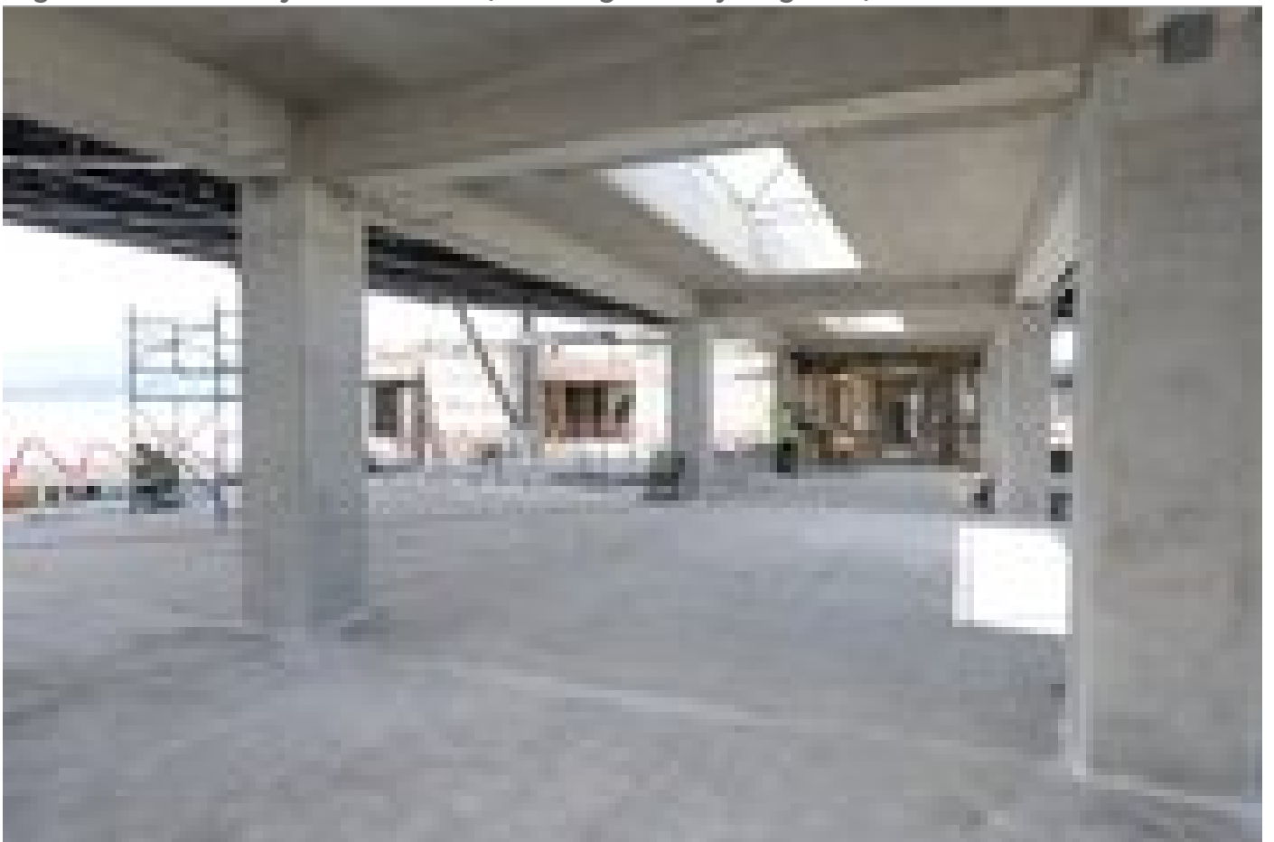
El edificio cuenta con pasillos de 3 metros de ancho, lo que en caso de emergencia permitirá una rápida evacuación.