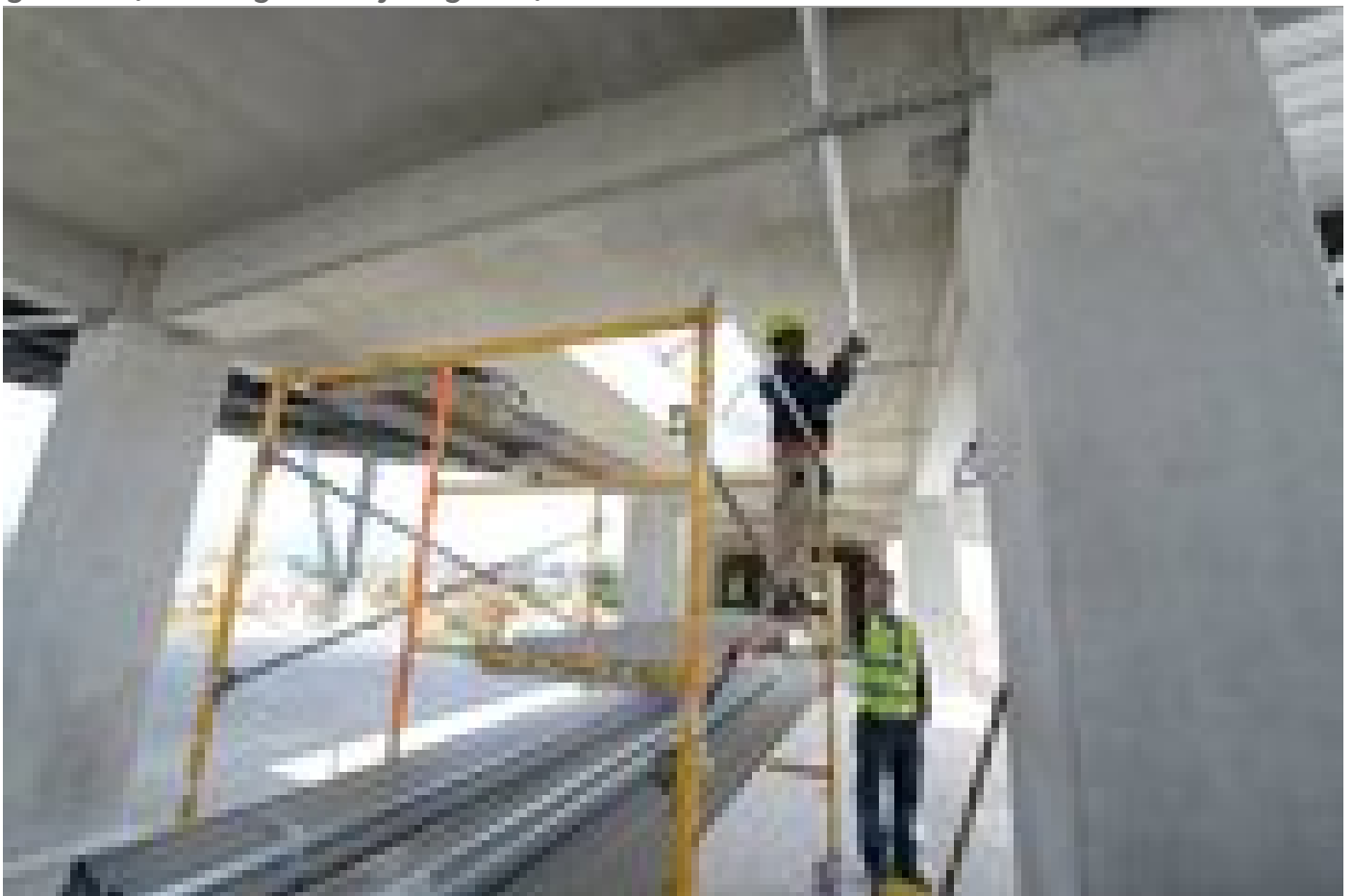
La empresa Edificar S.A. cuenta con gran cantidad de personal de planta trabajando en la construcción.