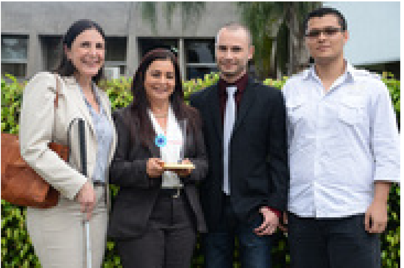
El equipo de trabajo del DEDUN recibió con gran satisfacción el reconocimiento en el acto de premiación en Casa Presidencial.