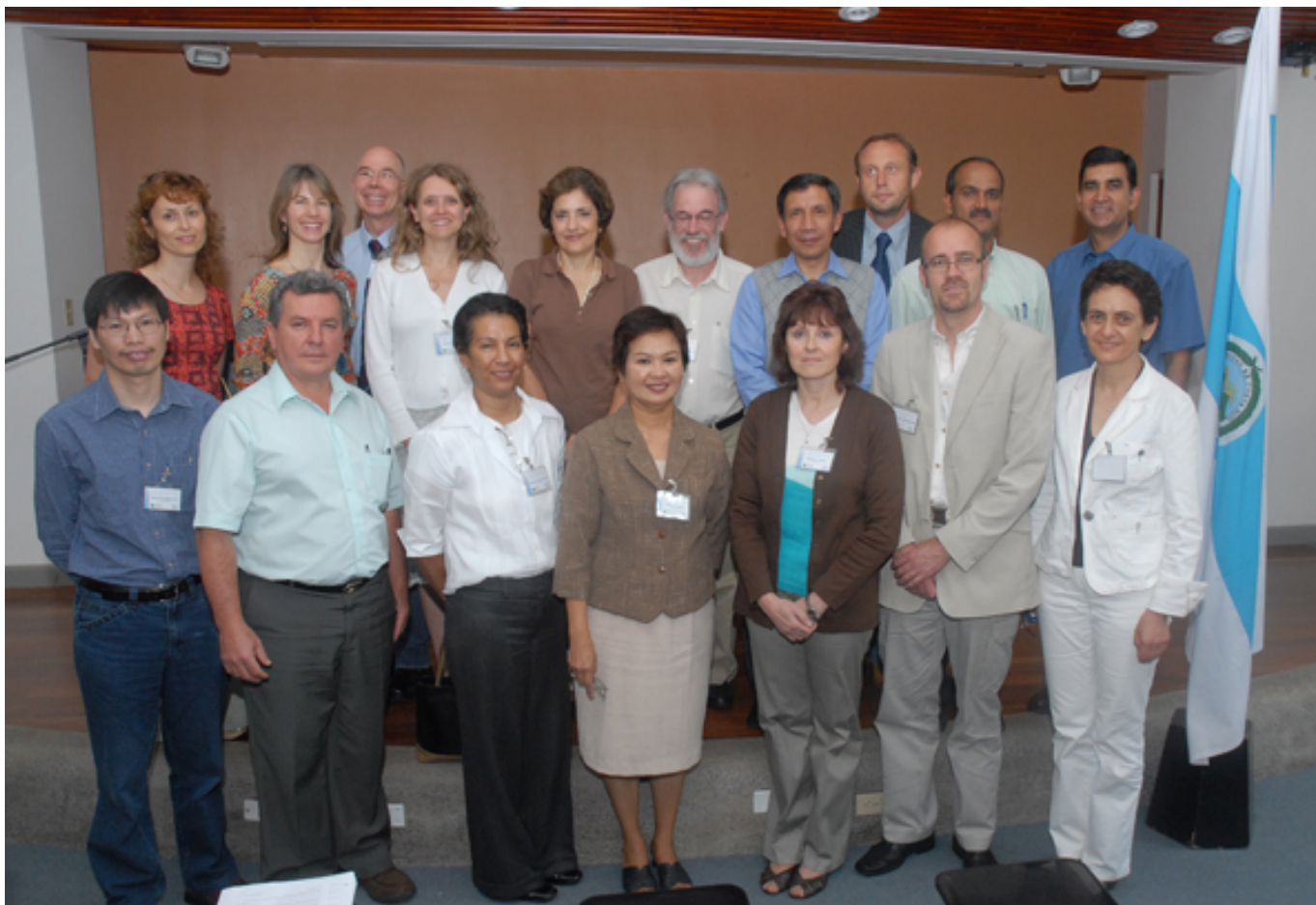
Participantes en el Curso-Taller sobre Prácticas agrícolas que organiza el CICA.

Los asistentes al taller provienen de Australia, Austria, Argentina, Bulgaria, China, Chipre, Ecuador, Alemania, India, Filipinas, Suecia, Brasil, Chile, y Costa Rica.