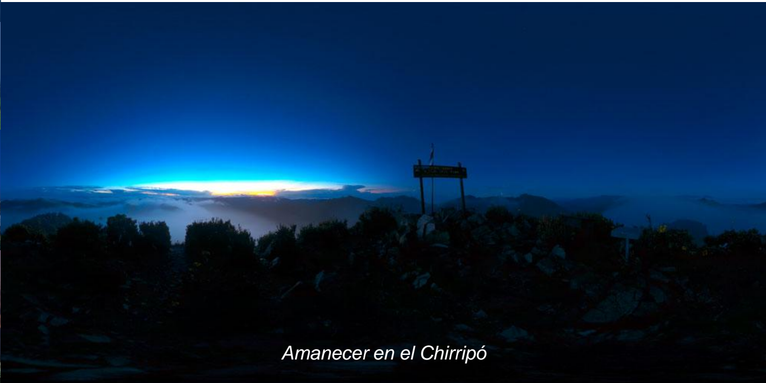
Amanecer en el Chirripó