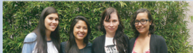
Sistematización de Experiencias