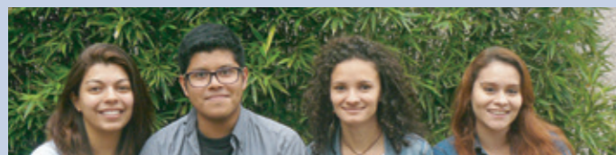
Sistematización de Experiencias

La experiencia permitió conocer las dinámicas de integración y trabajo en equipo interuniversitario.