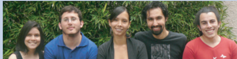
Diagnóstico y Sistematización de Experiencias

La experiencia se propuso como algo participativo, pues se buscó integrar ambos grupos de actores, esto permitió reflexionar sobre la incorporación de la visión cualitativa en la investigación sociológica.