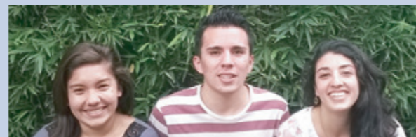
Sistematización de Experiencias

La experiencia ha permitido conocer la importancia del trabajo participativo y mecanismos de educación alternativos en cuestiones de empoderamiento.