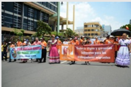
La conmemoración del centenario del 1° de mayo en Costa Rica contó con la participación de diversos grupos sociales que marcharon por las calles de San José.

■ Andrea Marín Castro | □ Categoría: Ciencias Sociales