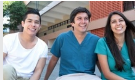
A partir de esta semana se inicia la campaña publicitaria, que consta de cinco mini vallas en las que posan como modelos estudiantes universitarios, las cuales fueron colocadas en diferentes sitios de la Ciudad Universitaria Rodrigo Facio.

Desde sus inicios cuenta con estudiantes centroamericanos, actualmente tiene tres estudiantes de México y uno de Venezuela , los demás son costarricenses. En años anteriores ha formado estudiantes de Colombia, Ecuador, Perú y ha recibido visitantes extranjeros.