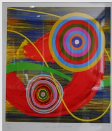
"Movimiento lunar" es otra de las

Acerca de la obra de Maffioli, el crítico de arte Ricardo Pau-Llosa , expresa que "uno puede pensar que la mayoría de los artistas costarricenses gravitan entre las imágenes de una indiscutible naturaleza luminosa -la selva, los volcanes, las playas, los bosques lluviosos, las cascadas, las flores, las ranas y las mariposas. Sin embargo, mientras que los colores y las formas del mundo natural dan vida a la paleta y a la imaginación de muchos pintores de esta nación centroamericana, muy pocos artistas han hecho de su intimidad con ella una preocupación predominante en su obra ".