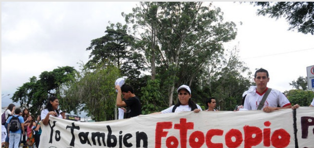
Estudiantes universitarios, profesores y miembros del movimiento "Fotocopiando para estudiar" saldrán de los alrededores del pretil de la Universidad de Costa Rica (UCR) para exigir el resello de la ley 17.342

■ Tatiana Carmona Rizo | □ Categoría: Vida Estudiantil