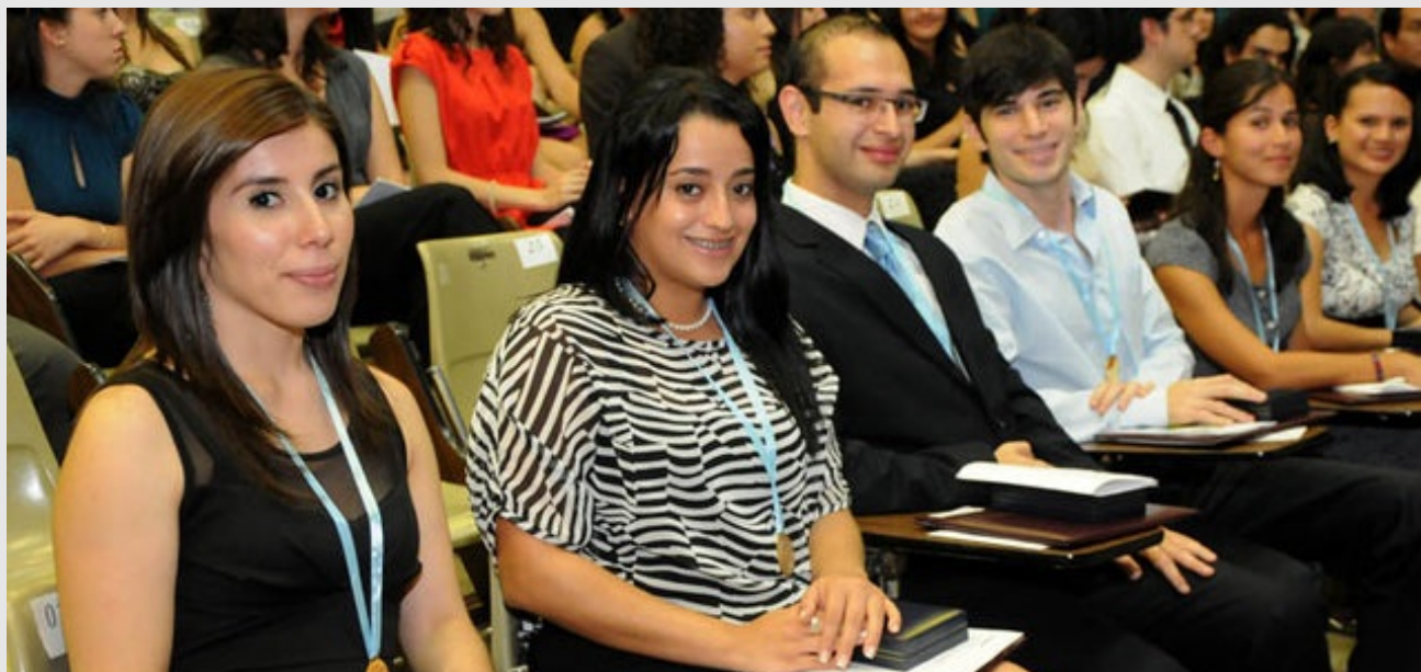
Las y los estudiantes homenajeados lucen orgullosos la medalla que se les otorgó.

■ María Eugenia Fonseca Calvo | □ Categoría: Homenajes