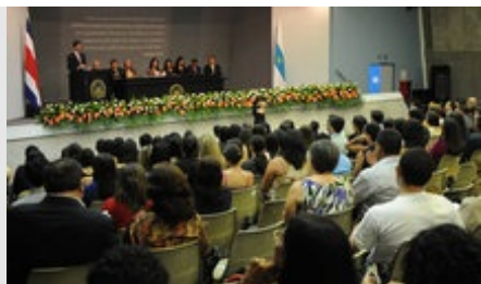
Este acto de reconocimiento contó con la participación de autoridades universitarias, estudiantes homenajeados y padres de familia.

o el mejor es una tarea compleja en la que una nota solo constituye un elemento fundamental pero no todo lo esencial. Ser los mejores en la Universidad de Costa Rica implica excelencia, vocación y compromiso con la sociedad. Significa entrega a una causa y nunca ningún graduado de nuestra Universidad debería anteponer lo material a fines humanistas como es la profesión que ha escogido”.