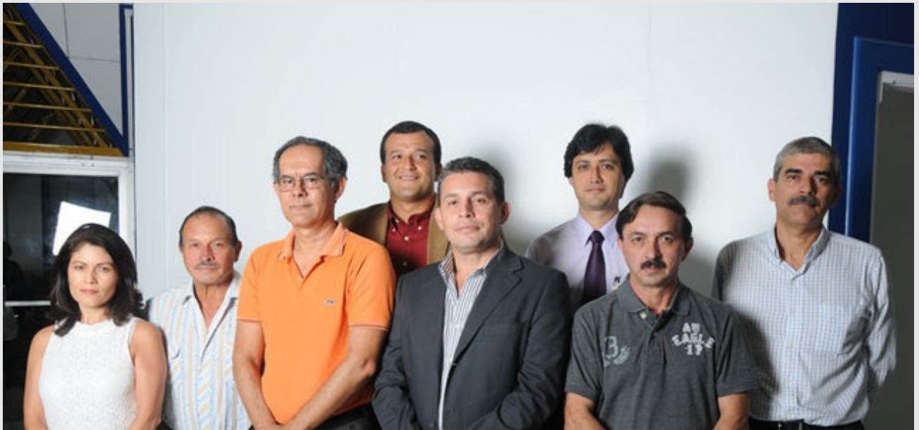
La mayoría de los aspirantes al Consejo Universitario por el sector administrativo, lucharán por una mayor representación del sector en los órganos decisorios de la UCR.

■ Rocío Marín González | ■ Categoría: La U Elige