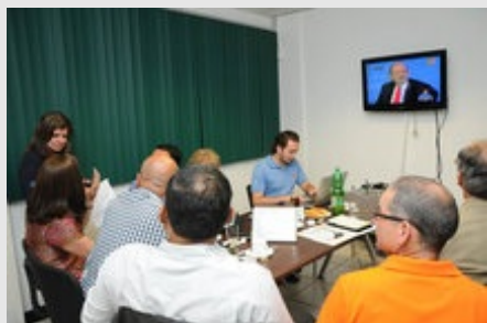
En una sala contigua al estudio principal de Canal 15 se concentraron integrantes del TEU, la directora del Canal y algunos seguidores y seguidoras de los tres candidatos que aspiran a la Rectoría de la UCR.

El Dr. Oldemar Rodríguez respondió que no se deben firmar acuerdos tan importantes, y puso de ejemplo el FEES, sin pedir la opinión del Consejo Universitario, además los diferentes sectores de la universidad deben estar informados para que no existan problemas.