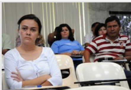
Los participantes en el foro cuestionaron a los candidatos acerca de sus propuestas en materia ambiental y en el tema de la diversidad funcional para que las personas con discapacidades tengan acceso a los diversos servicios.

actuales Sedes y Recintos , cuya creación en el caso de la UCR obedeció a una decisión tomada en los años 70.