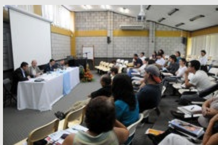
El apoyo a los estudiantes de las Sedes Regionales para que no abandonen sus estudios fue otra de las preocupaciones de los docentes que participaron en el debate

Otros temas abordados por los candidatos en respuesta a inquietudes de las personas presentes fueron cómo solventar las necesidades de infraestructura, en particular de residenciales estudiantiles, de modernas bibliotecas interconectadas y con los recursos bibliográficos necesarios.