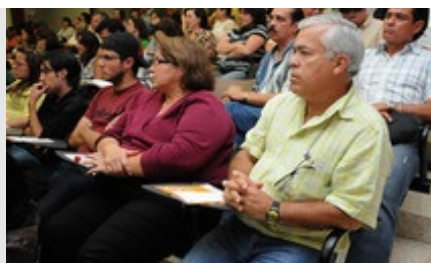
Los asistentes al primer debate del TEU lograron conocer más a fondo las propuestas de los candidatos a la Rectoría 2012-2016.

“Haremos una institución que revise las políticas de admisión para contribuir a una universidad más justa e incluyente, y al mismo tiempo buscaremos aumentar la designación de docentes en propiedad”, reveló.