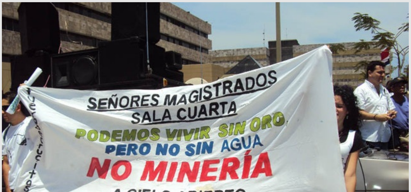
Los conflictos sociales en defensa de los recursos naturales son una reacción a hecho de que el Estado no está respondiendo a los intereses y necesidades de las mayorías, opinaron los especialistas.

■ Patricia Blanco Picado | □ Categoría: Medio Ambiente