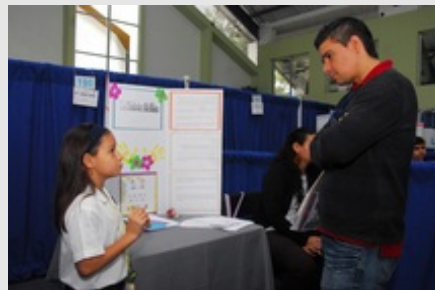
El público tendrá la oportunidad de visitar y conocer los proyectos expuestos este jueves de 8:00 a. m. 5:00 p.m., en las Instalaciones Deportivas de la UCR.

Los 199 proyectos realizados por estudiantes de primaria y secundaria de las 24 regiones educativas del país serán expuestos al público y juzgados por 200 especialistas de distintas instituciones del país, el jueves 10 de noviembre, de 8:00 a. m. a 5:00 p. m., en las Instalaciones Deportivas de la UCR en Sabanilla de Montes de Oca.