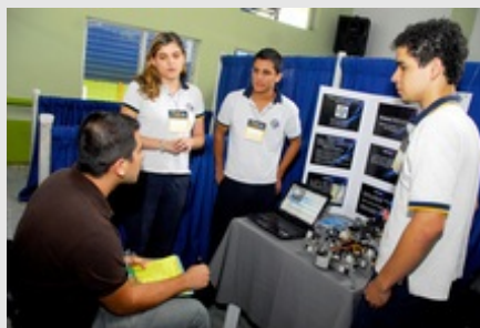
Cada proyecto es juzgado por especialistas de distintas instituciones del país.

Se ha venido desarrollando en forma ininterrumpida durante estos 25 años, en los cuales ha contribuido con el desarrollo de la creatividad y el pensamiento crítico de los y las estudiantes del Sistema Educativo Nacional , con la elaboración de numerosos proyectos de indagación e investigación.