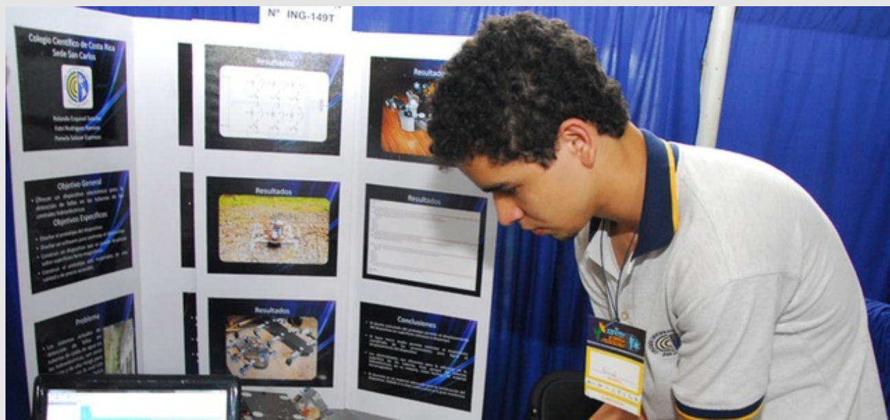
La Feria Nacional de Ciencia y Tecnología pretende generar un cambio en favor de la ciencia y la tecnología.

■ María Eugenia Fonseca Calvo | ■ Categoría: Tecnología