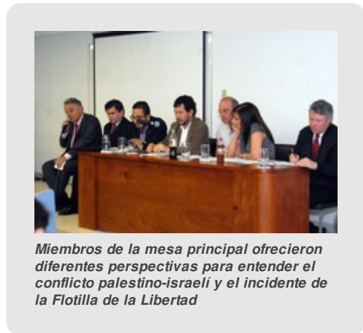
Miembros de la mesa principal ofrecieron diferentes perspectivas para entender el conflicto palestino-israelí y el incidente de la Flotilla de la Libertad